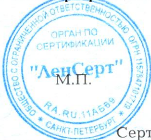
Схема сертификации Зс.